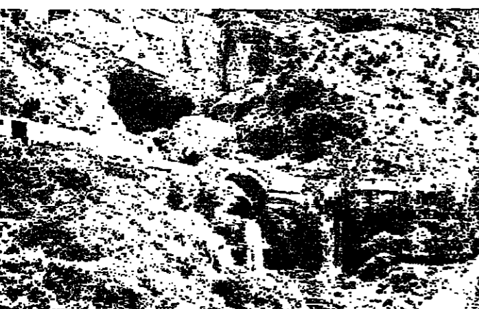
شلالات المياه تسري كسروان جبيل